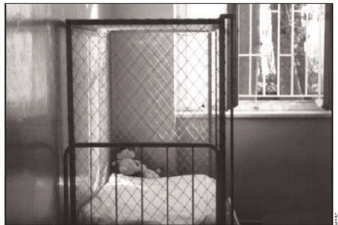
Camas-jaula. Yugoslavia, 2002

Y a continuación se incluye una fotografía de "camas jaula" que bien podría haber sido hecha a principios o mediados del siglo pasado pero que, por desgracia, pertenece a la actualidad: Al parecer, en varios países de centro Europa y Europa del este (República Checa, Hungría, Eslovaquia y Eslovenia) las dificultades en cuanto a los medios de contención y dotación de personal, hacen que en el siglo XXI se sigan utilizando "artefactos" como este, donde encerrar a los pacientes difíciles y/o agitados. Desde la AEN se envió un escrito a los representantes políticos de los países afectados denunciando esta situación.