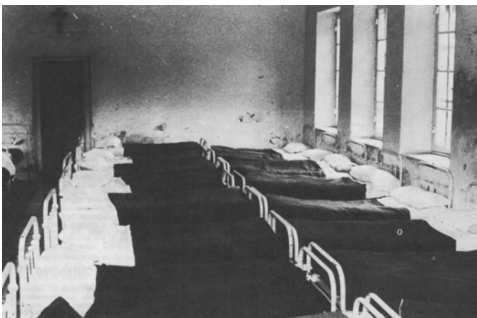
Dormitorio "comunitario" en el antiguo Bermeo

En la línea de recuperar y conservar documentos y fotografías relacionados con el pasado de la especialidad en nuestro medio, se incluye una antigua fotografía de un dormitorio del Hospital Psiquiátrico de Bermeo. ¡Lo que va de ayer a hoy!