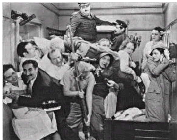
Animado debate durante una reunión de la Junta Directiva

¡En fin!. No nos deprimamos, que comienza un nuevo año, acompañado de los tópicos sobre los buenos propósitos, expectativas y demás. Aunque con algo de retraso, la Junta Directiva de OME os envía sus mejores deseos para el 2004.