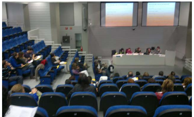
Imagen del auditorio

A resaltar la coincidencia entre la inauguración y el comunicado de ETA sobre el abandono de la violencia, lo que supuso una inmejorable noticia.