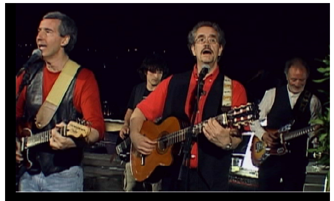
Los Beautiful Brains...

Se sirvió un lunch, tras el cual los Beautiful Brains nos deleitaron con algunos de sus "clásicos" (Serotonina, Panfilón, Doble Personalidad, etc.) presentando asimismo nuevas composiciones (En la Red, Tentación, Lipotimia) que nos hicieron pasar un rato inolvidable. Fue un estupendo colofón a unas jornadas magníficas.