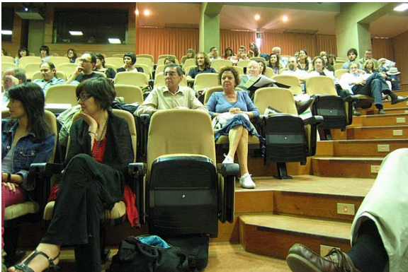
Vista de la sala de conferencias