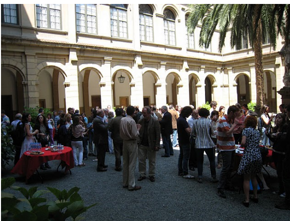
Los asistentes en animado coloquio