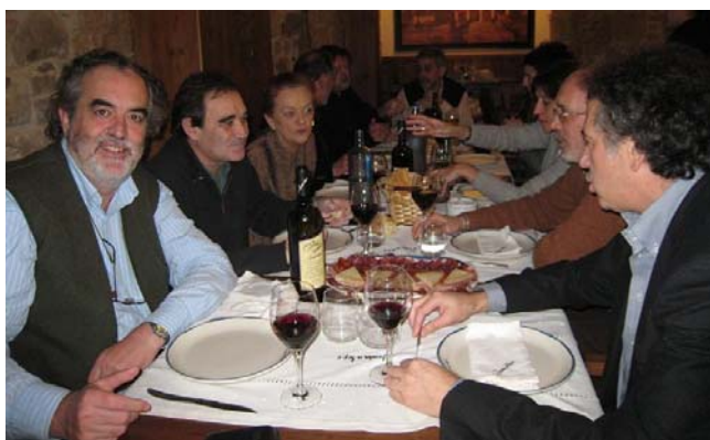
Vista parcial de la cena

Tras la jornada se celebró una cena que sirvió para pasar un rato agradable en buena compañía.