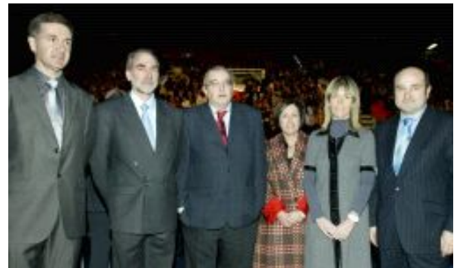
Los gerentes de las seis instituciones de Euskadi premiadas con Q de Oro