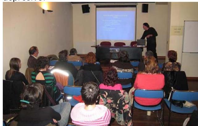
Vista general de sala

diagnóstico, la auto-percepción como profesionales y el desconocimiento mutuo condicionan los procesos de elaboración y manejo de la depresión. Los contextos sanitario y social se sitúan como referentes imprescindibles en la interpretación de sus percepciones respecto del paciente depresivo.