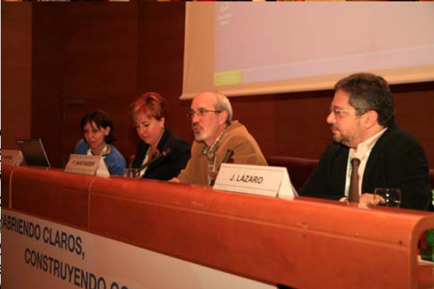
Espectros Claros y Psicosis Endógenas