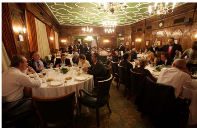
Imagen del comedor