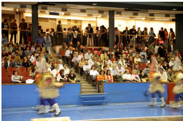
Muestra del folklore vasco

que tuvo lugar en el frontón del Club Deportivo de Bilbao.