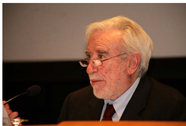
Prof. Castilla del Pino

El acto de clausura estuvo a cargo del Prof. Carlos Castilla del Pino con una enriquecedora conferencia, ("La razón de la psiquiatría") a cuyo término el público puesto en pie le dedicó una larga y calurosa ovación en reconocimiento a su trayectoria y compromiso con la psiquiatría, la salud mental, y la AEN a lo largo de toda una vida.