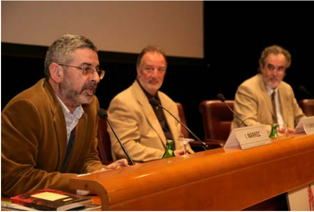
Acto de la entrega de premios