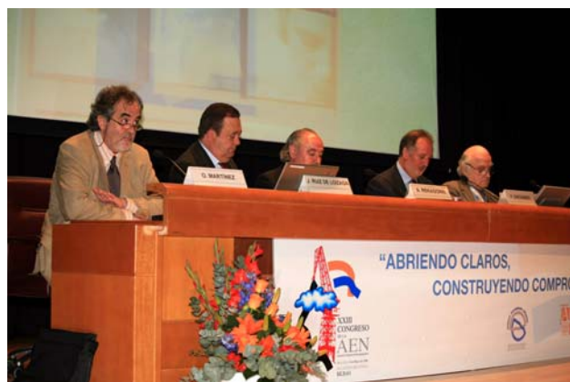
Acto de inauguración