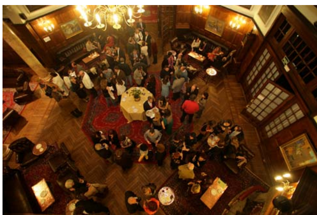
Vista general de la entrada

La cena de clausura tuvo lugar en La Bilbaína, lugar emblemático, y que supuso un digno colofón al congreso.